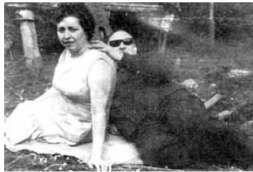
'O Piloto', posando xunto a súa compañeira, 'Mirelle'

O Piloto desoiu ás ordes do Partido Comunista de abandonar a resistencia armada e sobreviviu máis de tres lustros en numerosos escondites. A figura de O Piloto foi explotada polo réxime como a do derradeiro