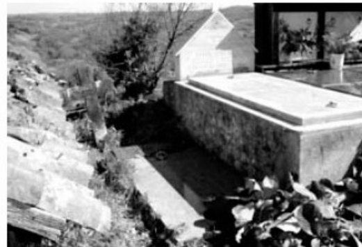
Tumba de 'O Piloto' no cimiterio de San Fiz

guerrilleiro, o derradeiro resistente que morreu coas armas na nan. Unha imaxe á que o PC tampouco renunciou.